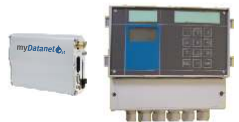
myDatalogMINI pour stations de pompage

Différents types d'instruments ont été utilisés pour les stations externes, capables de traiter entre 3 et 12 entrées (analogiques ou numériques) librement configurables. Les capteurs analogiques ou numériques existants, avec interfaces standard, peuvent être intégrés au système myDatanet sans nécessiter de programmation compliquée. Ainsi, des signalisations telles que le niveau du puisard, le niveau des sondes des bassins de retenue des eaux de pluie, l'alerte numérique en cas de panne et les impulsions de mesure de performance ont pu être ajoutées. D'autres signaux de fonctionnement, tels que la température, l'alimentation en tension et la force de champ GSM sont également enregistrés. Les volumes déversés, l'écoulement, etc. sont détectés par des canaux de comptage.